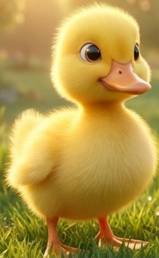
أصفر بالكامل كالشمس

كم كانت هدى مندهشة عندما لاحظت أن الصغار لا يشبهون بعضهم البعض! كل واحد منهم لديه لون يميزه ويجعله جميلاً بطريقته الخاصة.