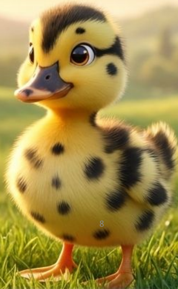
أصفر وأسود كاللوحه