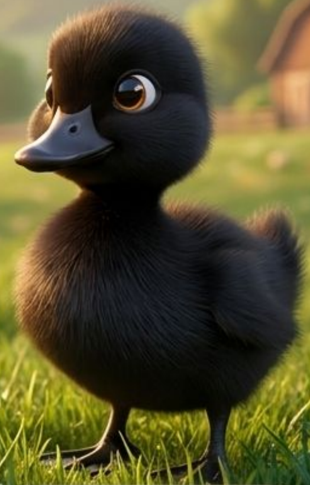
أسود لامع كالليل